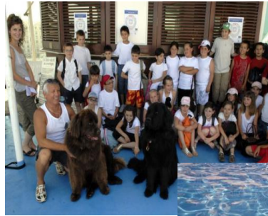
Ateliers « Mer en Fête »

Une soixantaine d'ateliers pédagogiques transdisciplinaires animés par des associations issues du pourtour méditerranéen, sont proposés à des élèves des académies d'Aix-Marseille et de Corse. Cette manifestation a pour but de promouvoir la mer Méditerranée comme une aire éco culturelle, de sensibiliser les jeunes à la connaissance, la protection et la valorisation de ce patrimoine naturel et culturel commun.