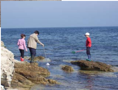
École de la Mer