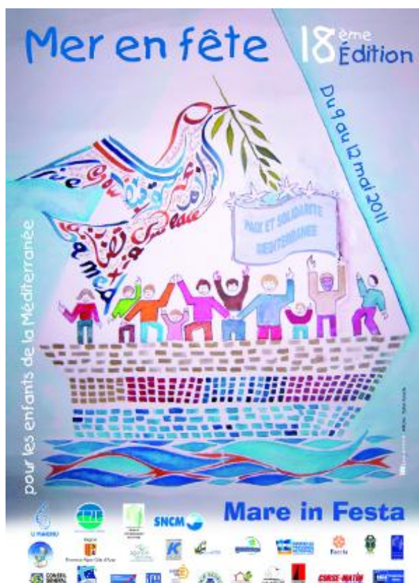
Effiche Mer en Fête 18 ème édition

Cette année sera la 19 ème édition de la mer en fête.